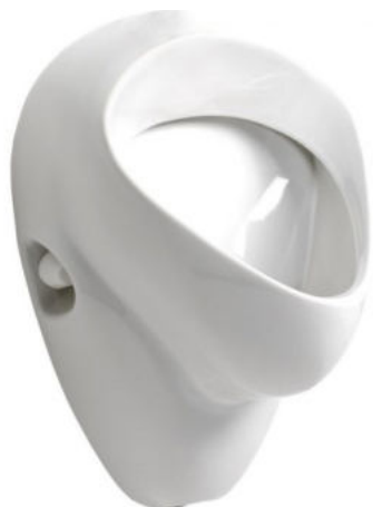
SLP 07 - NOVA PRO FELIX