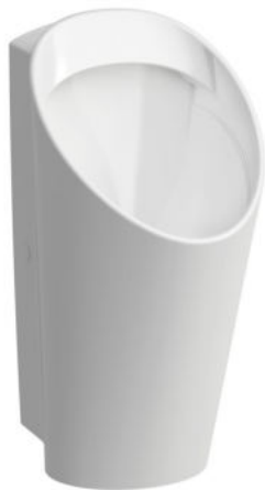
SLP 59 - LEMA RIMLESS