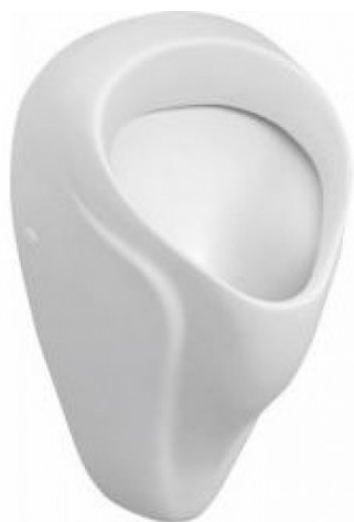
SLP 18 - NOVA PRO ALEX