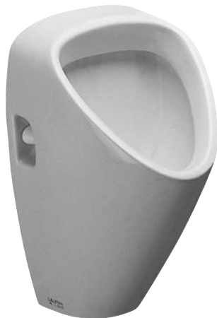
SLP 23 - CAPRINO