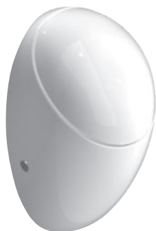
SLP 24 - ALESSI MIT DECKEL