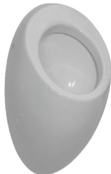
SLP 25 - ALESSI OHNE DECKEL