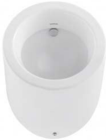
SLP 82 - WCA - Sanindusa