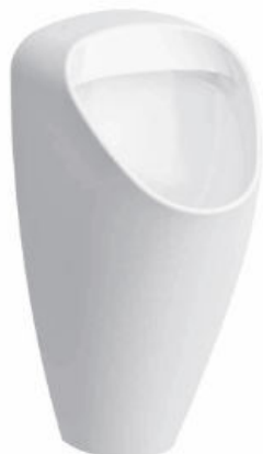
SLP 49 - CAPRINO PLUS RIMLESS